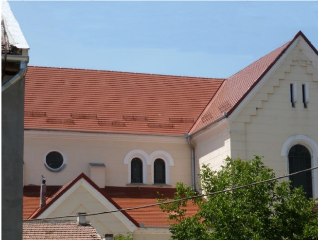
2017: Das vollkommen neu eingedeckte Kirchendach mit Taubenschutz und Schneeauffanggitter versehen .