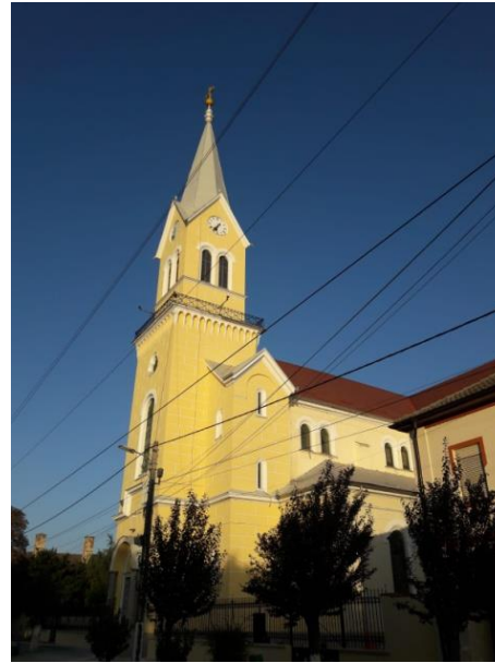
2020: Der Turm und die Frontfassade wurden saniert und neu gestrichen