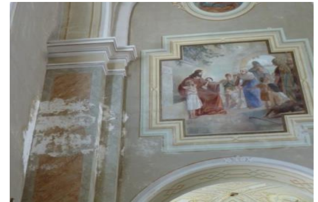
Schäden im Inneren der Kirche verursacht durch eingedrungenes Regenwasser.

2019 Der Innenputz wurde im unteren Bereich entfernt, die Fugen ausgekratzt und die Elektrik erneuert. Nach Austrocknung soll der Innenputz erneuert werden