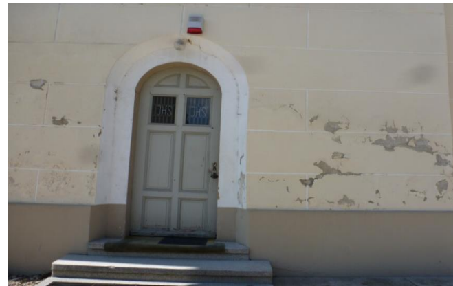
Schäden an der Seite Eingang zur Sakristei.