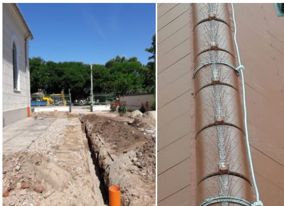
2019: Ableitung Regenwasser in die öffentliche Kanalisation 2017: Neu angebrachter Taubenschutz